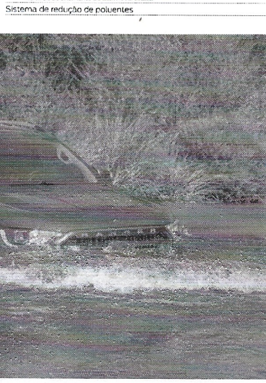
capacidade de imersão de 800mm e Nova Suspensão. Robustez e conforto

* Para o completo funcionamento do controle de oscilação de rebouque, é necessário a instalação do kit de rebouque original em uma concessionária Ford