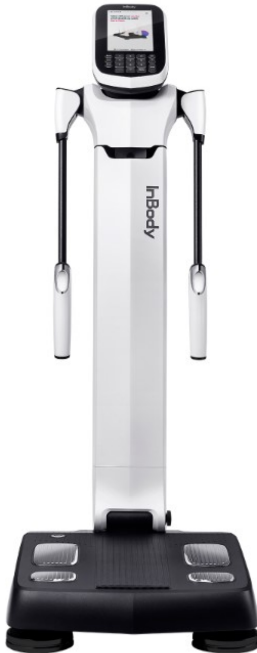
Figura 2 – Inbody 380

8.17. Na busca de soluções para os modelos especificados no mercado, deparou-se com a oferta de locação desses equipamentos com a mesmas marcas e modelos aos almejados por esta Instituição, especialmente a proposta da sociedade empresarial de nome fantasia Locafit ( https://locafit.com.br/ ), qual seja, R$7.000,00 (sete mil reais) mensais pelo modelo Inbody 380.