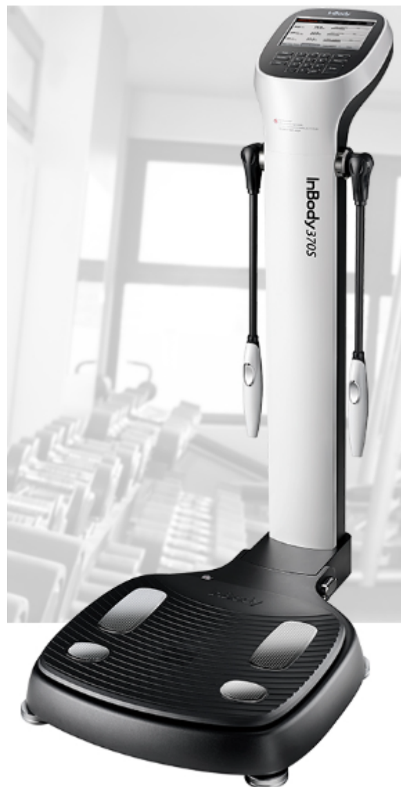
Figura 2 – Inbody 370s (meramente ilustrativo)