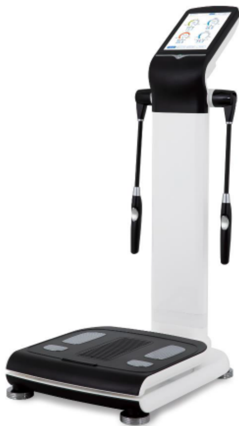
Figura 1 – Mediana i50